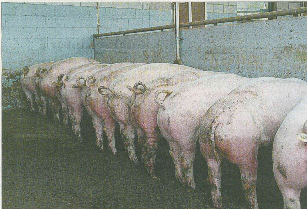
Der mangelnde Absatz bei den Schlachtschweinen führte zu einer weiteren «Preiskorrektur» von 20 Rappen.